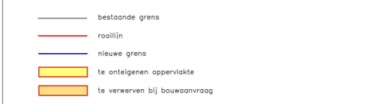
TABEL DER ONTEIGENINGEN - STAD HERENTALS - 3de en 4de AFDELING