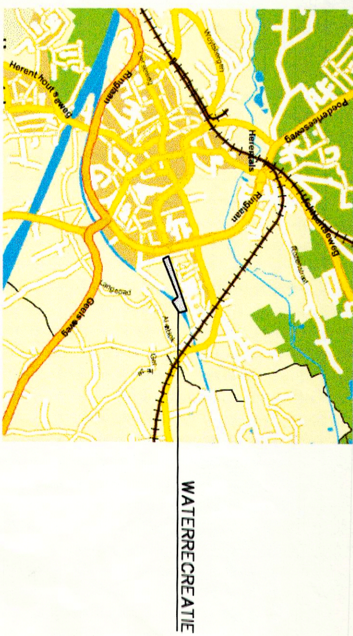
LIGGINGSPLAN SCHAL 1/40.000